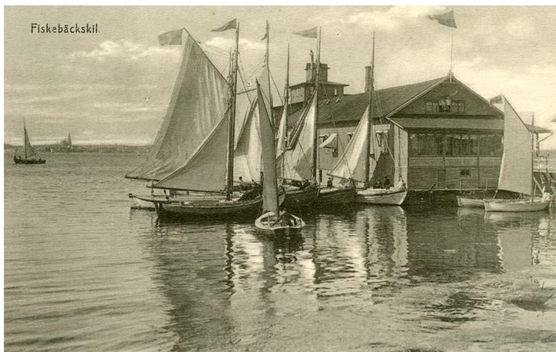
1917 Badinrättningen i Fiskebäckskil.

1917-08-11 Vid grävning å Kungsgatan vid torget i Lysekil för nedläggning av jordkabeln för den elektriska energin har påträffats ett gammalt vägmärke, en sten märkt "Stora Ulseröd". (Nya Lysekils-Kuriren, 1917-08-11/KJ)