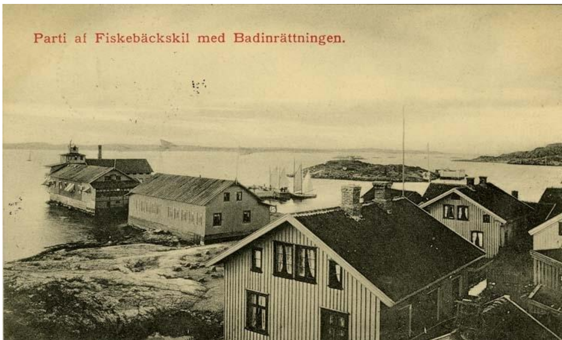
1917 Parti av Fiskebäckskil med Badinrättningen.