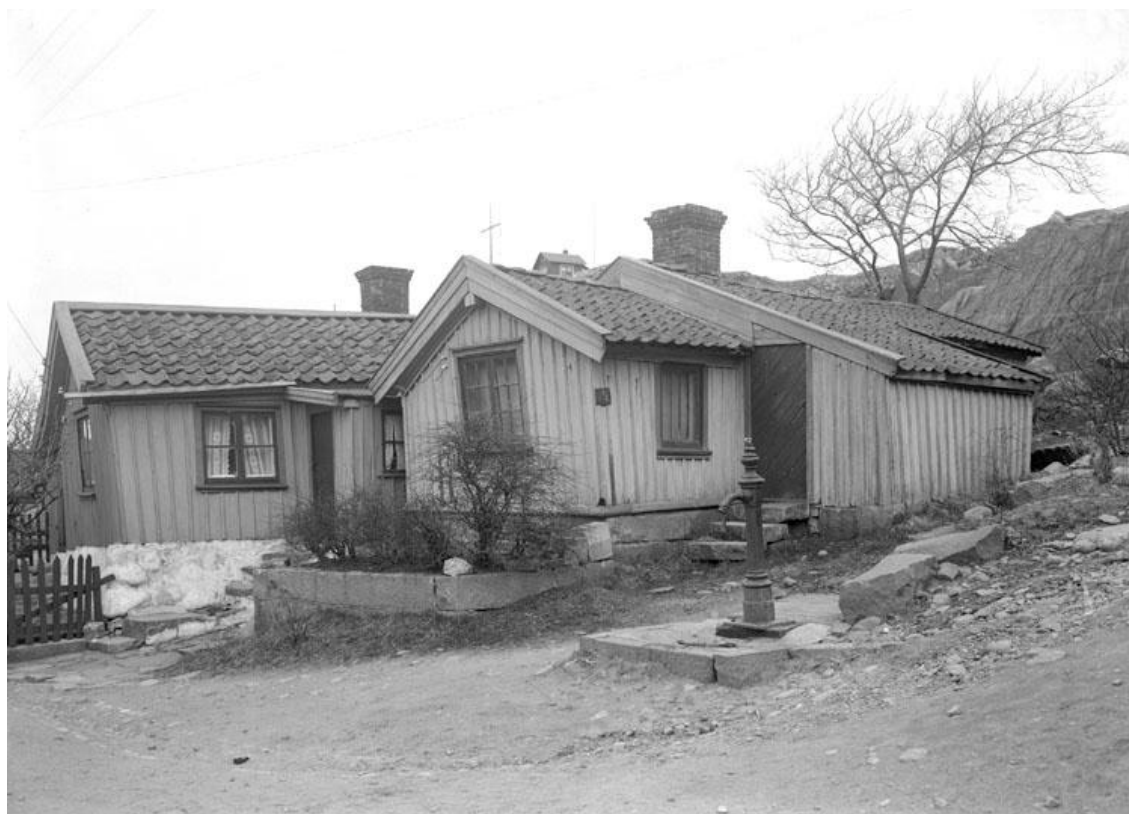
1924-04-.. Fotografiet visar husen på Bansviksgatan 14 (VI) och Bansviksgatan 14 (V).