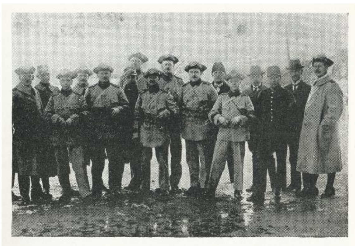
1924-03-.. Deltagare från Kvistrums landstormsförening vid marsövningen. (Svensk Försvarsvilja, Del II, sid 237)

På torsdag äga muntliga stridsövningar rum i trakten av Brodalen och på söndag försiggå övningar vid Munkedal och Kvistrum, omfattande bro- och järnvägsövervakning, orientering och avståndsbedömning, fältskjutningar i grupp med gevär och kulsprutegevär ävensom skjutningar med gevärsgranater. Övningarna står under överinseende av överstelöjtnant Lilliehöök samt ledas i Lysekil av instruktionsofficeren i Bohusläns landstormsförbund, löjtnant Anerås, samt i Munkedal av kapten Erasmie. (LP 1924-03-27)