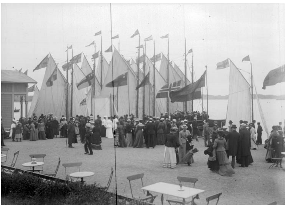
1900 En talrik människomassa i Havsbadet väntar på Oscar II:s ankomst.