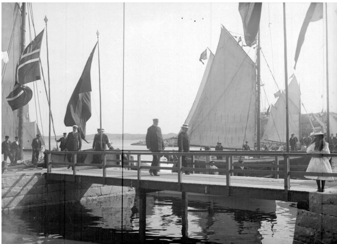
1900 Kung Oscar II landstiger vid Lysekils Havsbad.