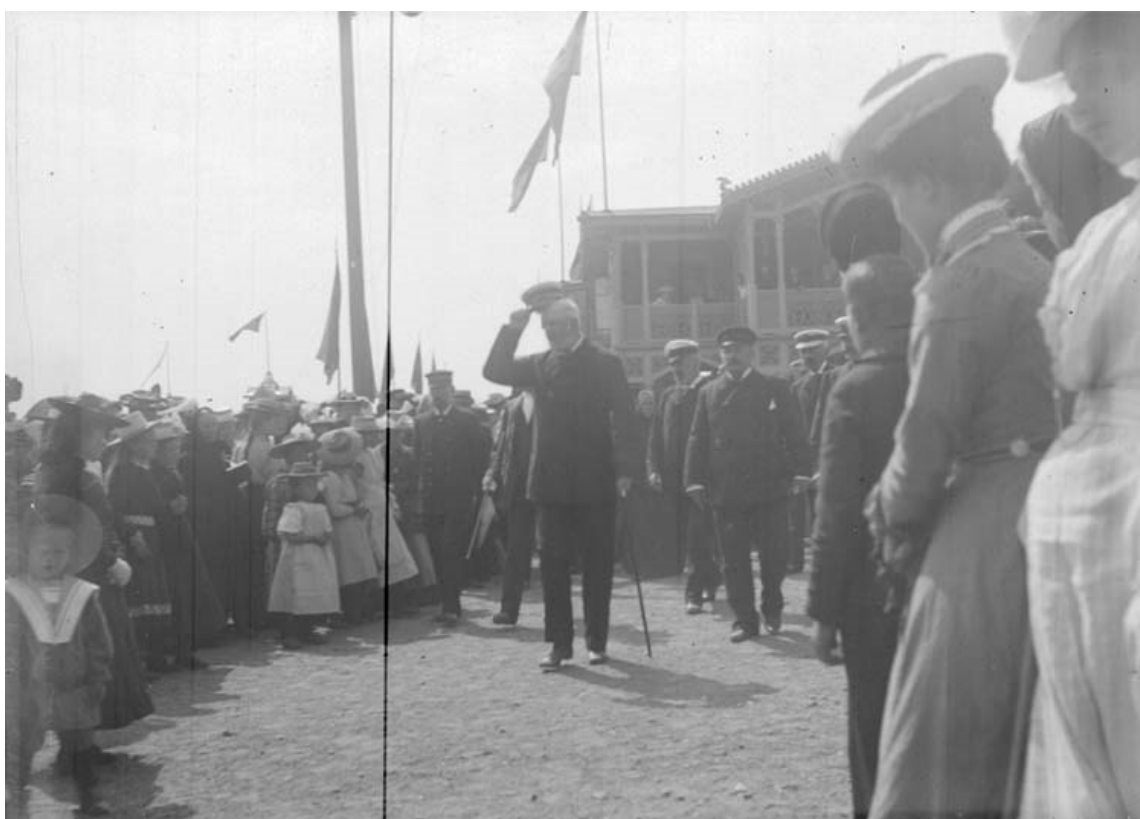
1900 Kung Oscar II hälsar på folket vid Lysekils Havsbad.