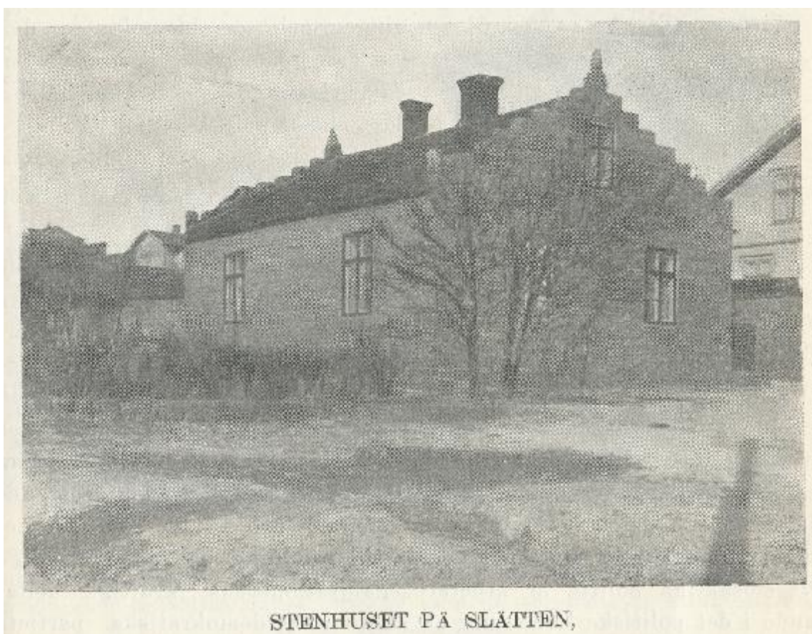
STENHUSET PÅ SLÄTTEN,