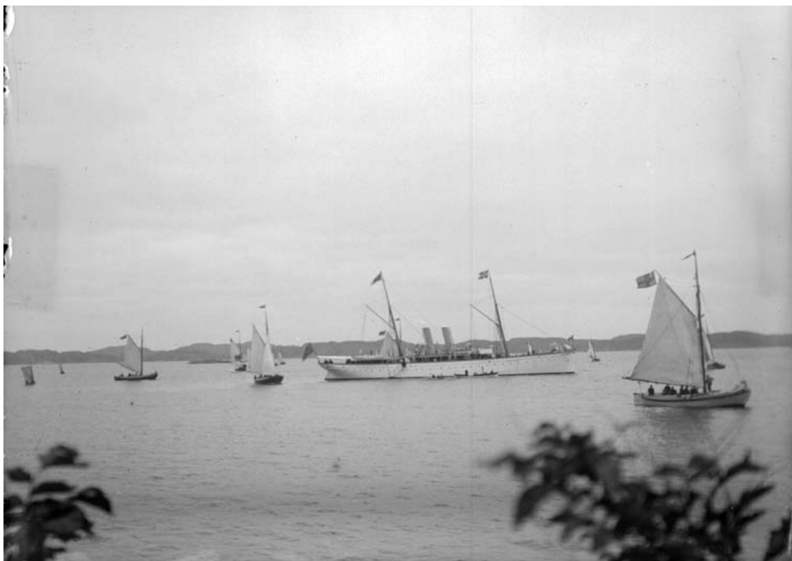
1900 Kungafartyget DROTT på redde utanför Havsbadet i Lysekil.