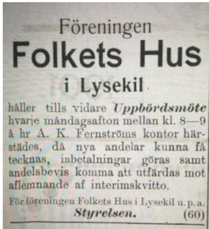
1901-06-12 Föreningen Folkets Hus i Lysekil.

Kommunalfullmäktige beslöt och i enlighet med nämndens förslag, samt att söka härför hos Kunglig Befallningshavande. (Lysekilskuriren 1901-06-08/KJ)