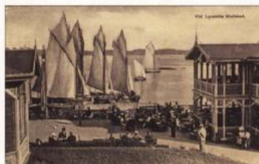
Gästhamnen låg strax intill, men detta verkar vara fiskares segelbåtar. Obegagnat vykort från 1910-talet.