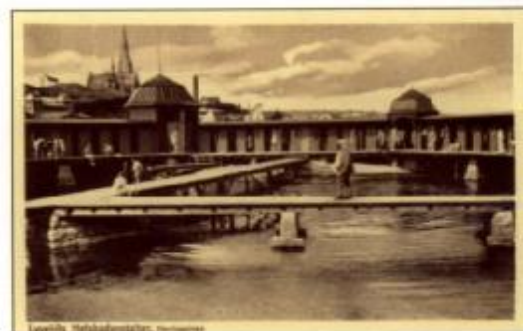
Herrarnas nya kallbadplaceras en god bit utanför damernas. Det fanns ingen möjlighet att spionera på damerna genom någon springa i hyttväggarna.

Bron till herrarnas nya kallbad byggdes ut ända till Släggö och färjan blev överflödig.