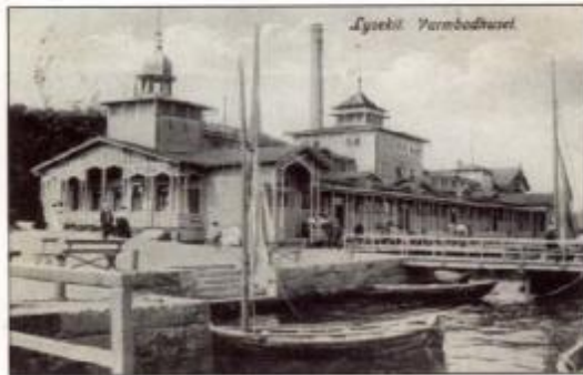
Ett senare kort på varmbadhuset, stämplat 1923. Inte lika mycket folk i rörelse som på tidigare kort.