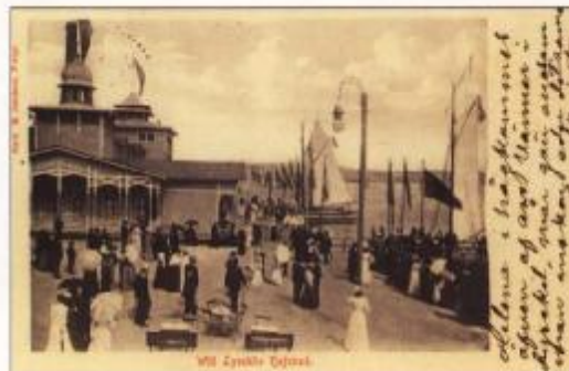
Badhuset på bilden invigdes 1864. Vykort till fröken Helena hos landshövding Lagerbring i Göteborg 1903.

Den öppna platsen mellan restaurant, societetshus och varmbadhus som visas på kabinetskortet på förra sidan kallades Trampen och var säkert vackra dagar den populäraste platsen för umgänge och vykortsskrivande vid borden på caféet eller på någon av de många sofforna. Flera vykort visar därför just den platsen.