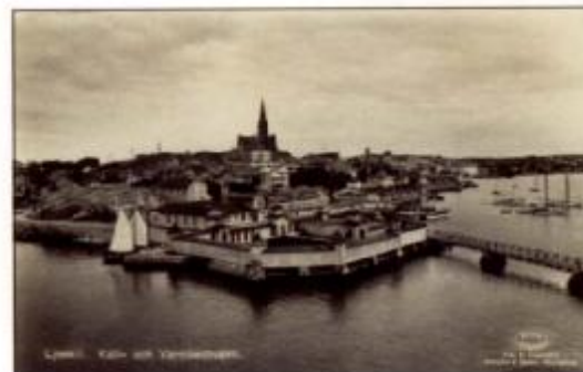
Damerna övertog så småningom herrarnas kallbad och det utbyggdes ganska snart. En bro leder ut till herrarnas nya anläggning. Kortet är stämplat 1935.