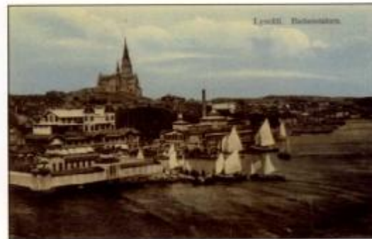
Vid slutet av 1910-talet låg fortfarande herrarnas bassin på sin ursprungliga plats och färjan till Släggö var kvar.

Med tiden behövde damerna ett större kallbad och då fick de överta herrarnas. Herrarna flyttade till en ny anläggning en bit längre ut mot Släggö. Damer och herrar kom på så sätt närmare varandra.